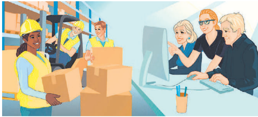
Wie können Arbeitsplätze gestaltet werden, dass sie für Fachkräfte attraktiv sind und gesundes und motiviertes Arbeiten bis zur Pension oder darüber hinaus ermöglichen.

FRICK. Was hält gesund und was macht krank. Wenn es um die Gesundheit am Arbeitsplatz geht, rücken neben Themen wie Bewegung, Ernährung oder Entspannung auch Begriffe in den Vordergrund, die auf den ersten Blick wenig mit Gesundheit